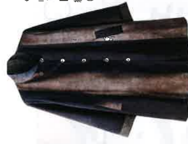
〈石川シルク〉 リバーシブルコート(泥染め) [1点限り] 216,000円 綿100%、サイズ：フリーサイズ(M～L対応)