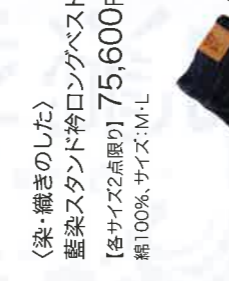
〈染・織きのした〉 藍染スタンド袴ロングベスト [各サイズ2点限り] 75,600円 綿100%、サイズ：M・L 初登場