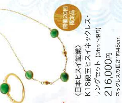
〈日本ヒスイ鉱業〉 K18硬玉ヒスイネックレス・ リングセット [3セット限り] 216,000円 ネックレスの長さ：約45cm 開催20回 限定品