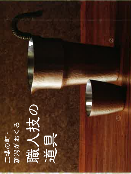
工場の町・新潟がおくる 職人技の道具 〈富貴堂〉ちるりぐい呑みセット [5セット限り] 34,020円 銅、容量：◎約80ml・◎約450ml

10月3日(水)～8日(月・祝) ※最終日は午後6時開場。 日本橋三越本店 本館7階 催物会場 主催：新潟市・(公財)新潟観光コンベンション協会・新潟市産産会