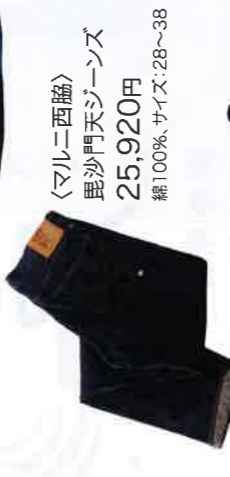
〈マルニ西脇〉 尾沙門天ジーンズ 25,920円 綿100%、サイズ：28～38