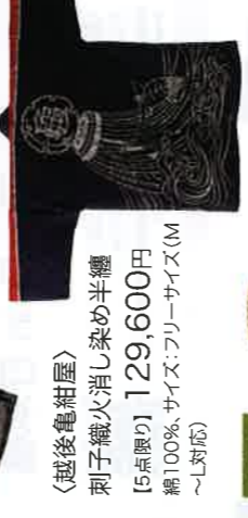
〈越後亀紺屋〉 刺子織火消し染め半纏 [5点限り] 129,600円 綿100%、サイズ：フリーサイズ(M～L対応)