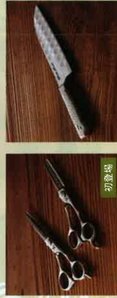
〈シゲル工業〉 セルフカットビギナーセット [5セット限り] 18,144円 ステンレス特殊合金鋼、長さ：15cm 初登場