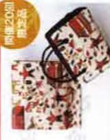
〈工房 藍美〉 L型アスナー長財布 袋帯・バッグセット各種 [3セット限り] 108,000円 やま草、サイズ：約20×10.5cm 帯：綿100% ※お仕立代別