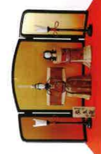
〈マリヤ人形店〉 木目込人形「弥生雛」 [2点限り] 140,400円 サイズ：約幅61×奥行46×高さ35cm