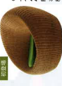
〈ワイ・エム・ケー長岡〉 アームレスチェア 216,000円 藤、サイズ：幅90×奥行85.5×高さ72.5cm ※お渡し：安注から約45日後