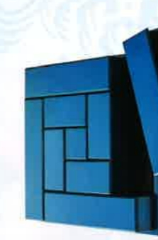
〈広沢漆芸〉平織重 [1点限り] 302,400円 天然木・化粧合板・布張・漆塗装、サイズ：約33×33×高さ7cm