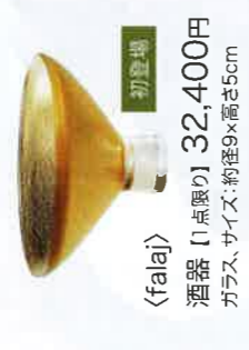
〈falaj〉 酒器 [1点限り] 32,400円 ガラス、サイズ：約径9×高さ5cm 初登場