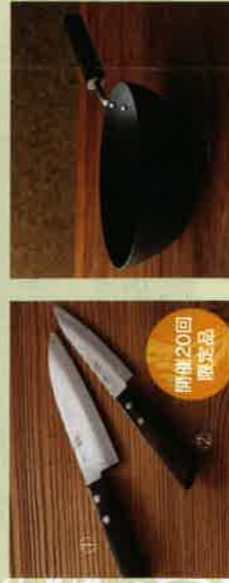
〈河清刃物工業〉三徳包丁・ ペティナイフ2本セット [20セット限り] 21,600円 特殊鋼、刃渡り：◎14cm・◎11cm 開催20回 限定品