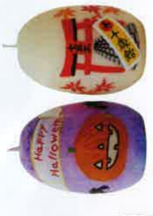
〈岡田燦燦店〉 朱鷺のたまごキャンドル 12カ月の風物詩(12種セット) [3セット限り] 19,440円 蜜蝋・ヒマシ硬化油・綿芯、高さ約6cm 開催20回 限定品