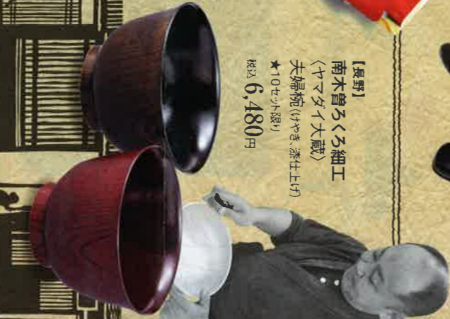
お買上げますタタムリ ■本館で開催場、8階リフト 右記対象産地にてそれぞれお買上げください ※お買上げの際は必ずお買上げの品名を お買い上げの際は必ずお買上げの品名を

お買上げますタタムリ ■本館で開催場、8階リフト 右記対象産地にてそれぞれお買上げください ※お買上げの際は必ずお買上げの品名を