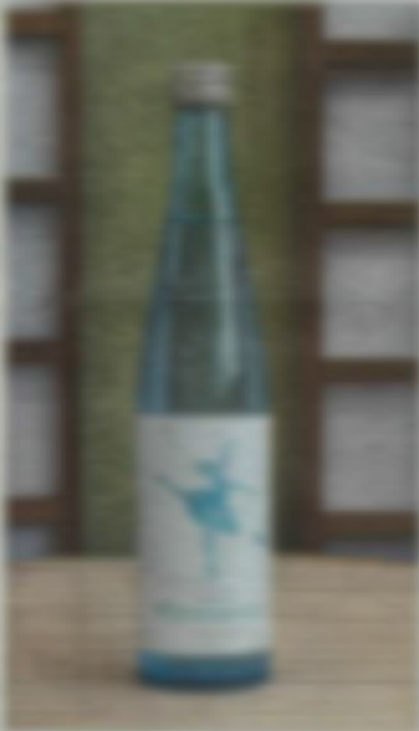
「Blue Snow White」500本 あす発売